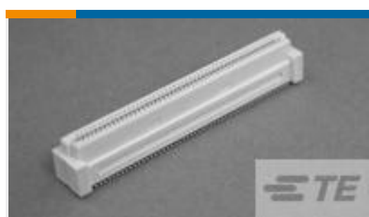
TE 产品编号5-5179180-3 0.8FH,R09H.5,080,08/Sn,TR,SC