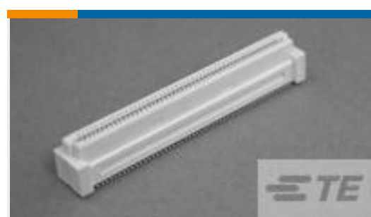
TE 产品编号5-5179180-2 0.8FH,R09H.5,060,08/Sn,TR,SC