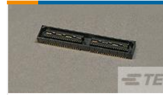
TE 产品编号6-1658043-2 MSB0.80RC-ASY080FL,GP,F,-TR