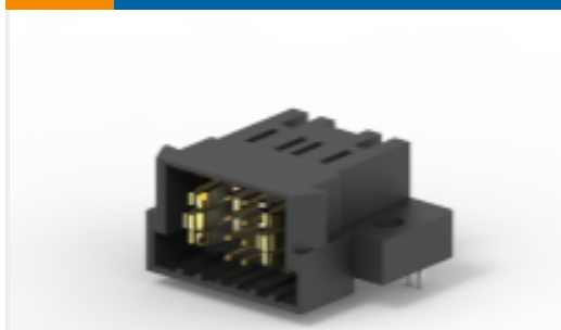
TE 产品编号6450834-1 MBXL R/A HDR STR 1P/8S/1P