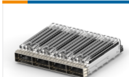
TE 产品编号5-2170790-4 CAGE ASSY, 1X4, QSFP28, SPRING, HS, LP