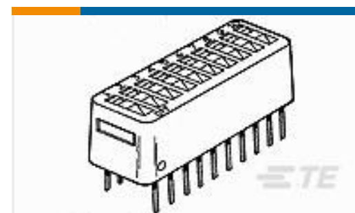
TE 产品编号2-5435668-8 DIP SW 8 POSN W/TAPE AU