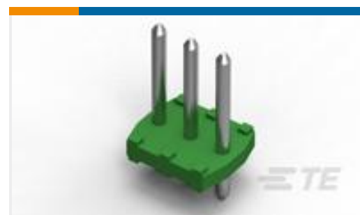
TE 产品编号1986718-3 HEADER, 3P, 3.5 PCB 16.5 H WB