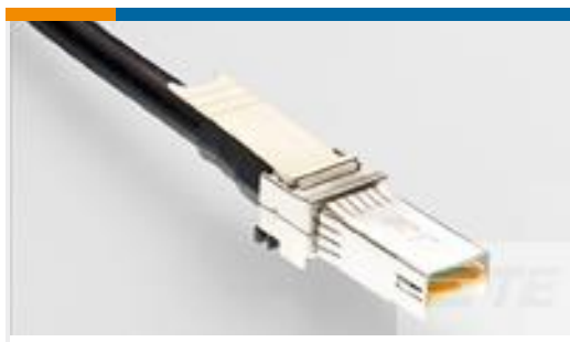
TE 产品编号 2142970-3 CABLE ASSY, MICRO SFP+ TO STD SFP+, 2M