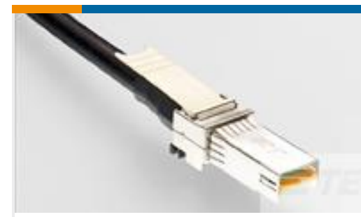
TE 产品编号 2142970-6 CABLE ASSY, MICRO SFP+ TO STD SFP+, 5M