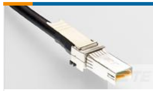
TE 产品编号 2142970-4 CABLE ASSY, MICRO SFP+ TO STD SFP+, 3M