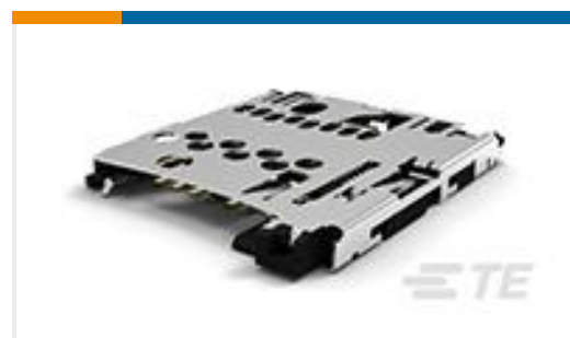
TE 产品编号2201778-1 MICRO SD PUSH PUSH LOW PROFILE TYPE