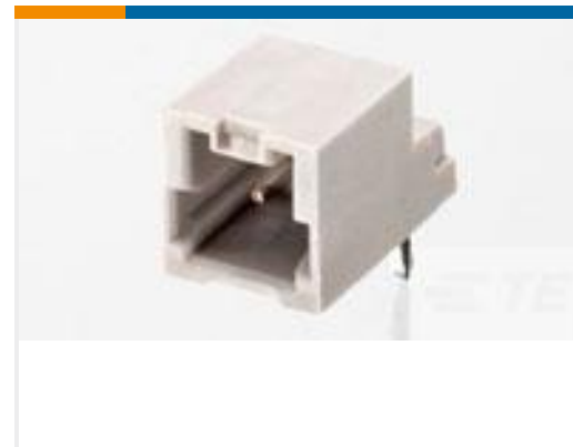
TE 产品编号292206-6 MINI CT SGL DIP H 6P NAT