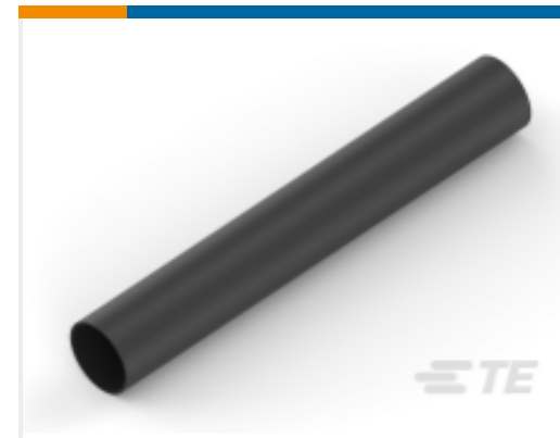
TE 产品编号NB11022001 ATUM-4/1-0-STK