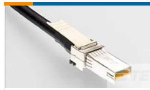
TE 产品编号 2142970-5 CABLE ASSY, MICRO SFP+ TO STD SFP+, 4M