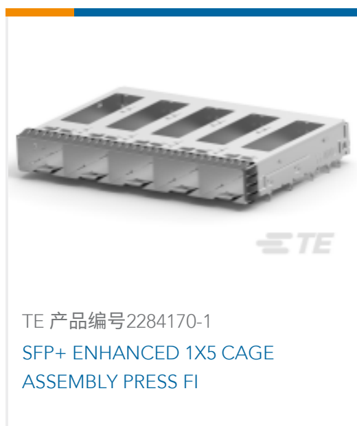
TE 产品编号2284170-1 SFP+ ENHANCED 1X5 CAGE ASSEMBLY PRESS FI