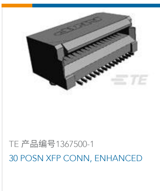
TE 产品编号1367500-1 30 POSN XFP CONN, ENHANCED