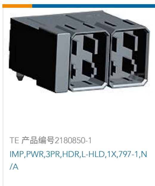
TE 产品编号2180850-1 IMP,PWR,3PR,HDR,L-HLD,1X,797-1,N /A