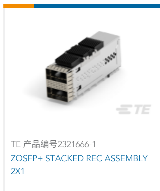
TE 产品编号2321666-1 ZQSFP+ STACKED REC ASSEMBLY 2X1