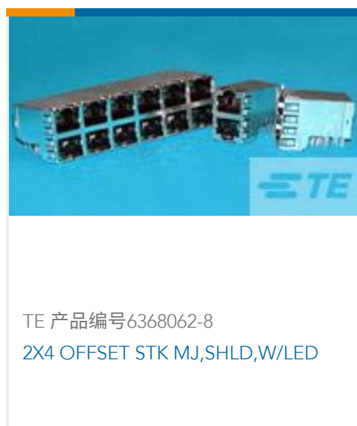
TE 产品编号6368062-8 2X4 OFFSET STK MJ,SHLD,W/LED