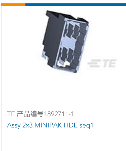
TE 产品编号1892711-1 Assy 2x3 MINIPAK HDE seq1