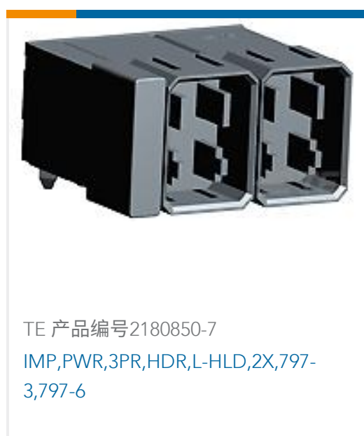
TE 产品编号2180850-7 IMP,PWR,3PR,HDR,L-HLD,2X,797-3,797-6