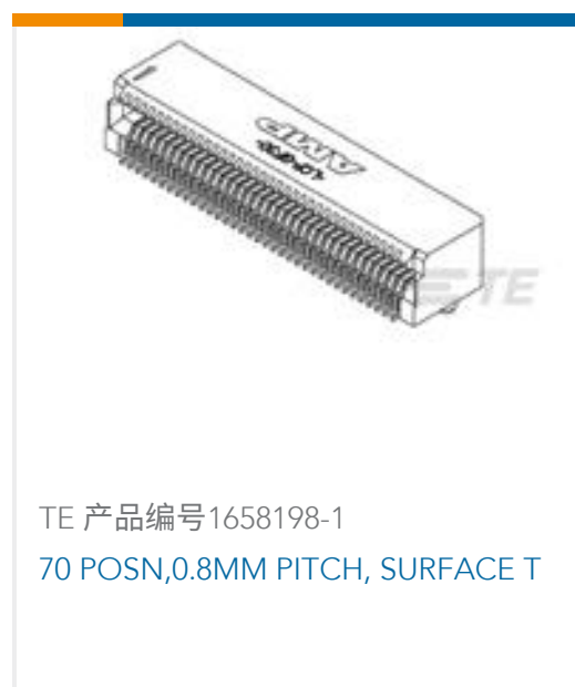
TE 产品编号1658198-1 70 POSN,0.8MM PITCH, SURFACE T