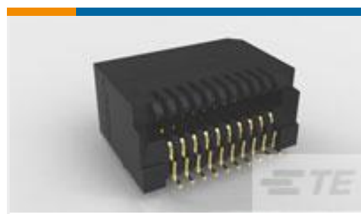
TE 产品编号1888247-1 20 POS SMT CONN, SFP/SFP+, 30A