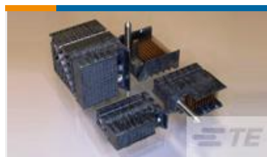
TE 产品编号2143313-2 IMP100S,H,RA2P16C,LG,OEWS39,4.9