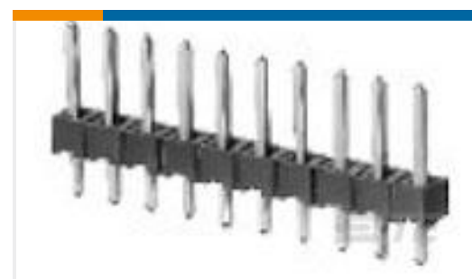
TE 产品编号5-146280-2 02 MODII HDR SRST B/A .100CL