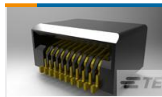
TE 产品编号2170088-1 ZSFP+ Connector,30u"