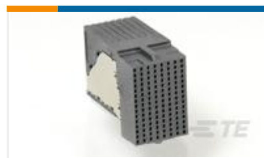
TE 产品编号1934226-1 Tin man Recpt Assy3pair8 Colum