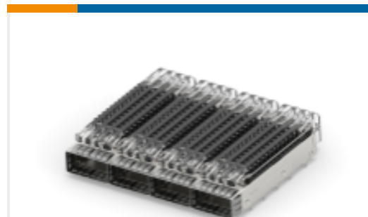
TE 产品编号2170378-2 1X4 QSFP KIT ASSY LP&HS