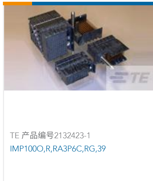
TE 产品编号2132423-1 IMP100O,R,RA3P6C,RG,39