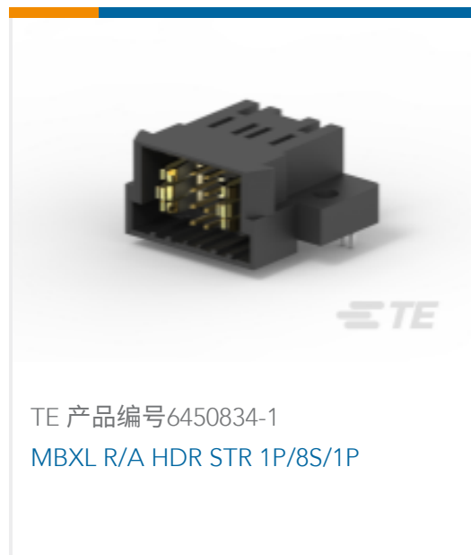
TE 产品编号6450834-1 MBXL R/A HDR STR 1P/8S/1P