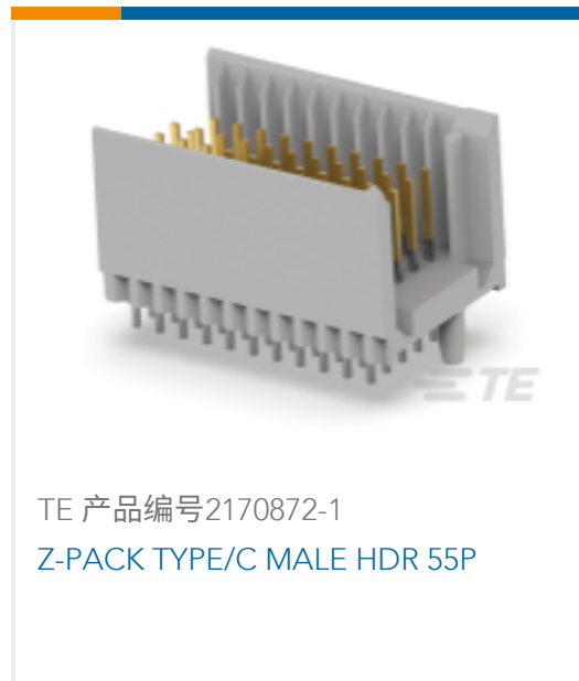
TE 产品编号2170872-1 Z-PACK TYPE/C MALE HDR 55P