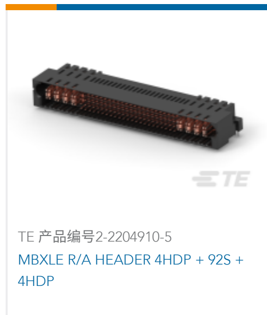
TE 产品编号2-2204910-5 MBXLE R/A HEADER 4HDP + 92S + 4HDP