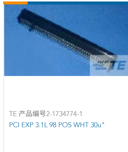
TE 产品编号2-1734774-1 PCI EXP 3.1L 98 POS WHT 30u"