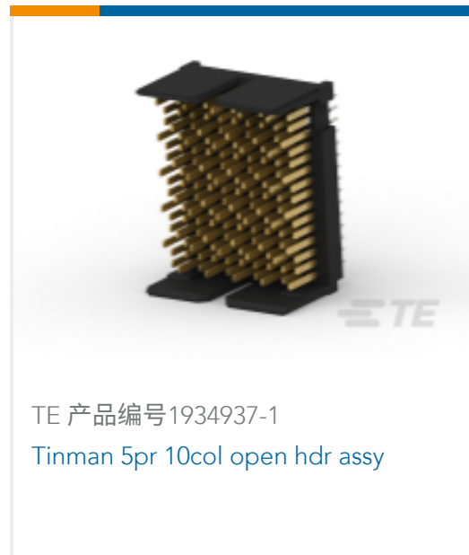
TE 产品编号1934937-1 Tinman 5pr 10col open hdr assy