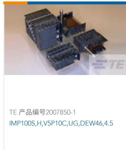
TE 产品编号2007850-1 IMP100S,H,V5P10C,UG,DEW46,4.5