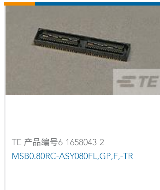
TE 产品编号6-1658043-2 MSB0.80RC-ASY080FL,GP,F,-TR