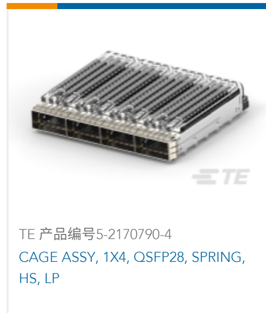
TE 产品编号5-2170790-4 CAGE ASSY, 1X4, QSFP28, SPRING, HS, LP