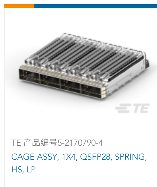
TE 产品编号5-2170790-4 CAGE ASSY, 1X4, QSFP28, SPRING, HS, LP