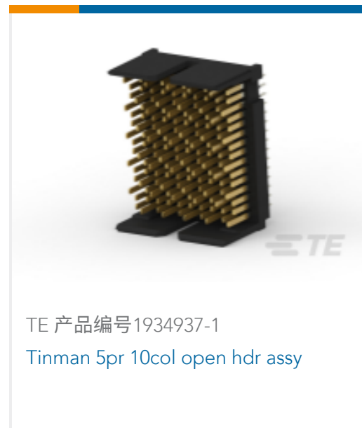
TE 产品编号1934937-1 Tinman Spr 10col open hdr assy