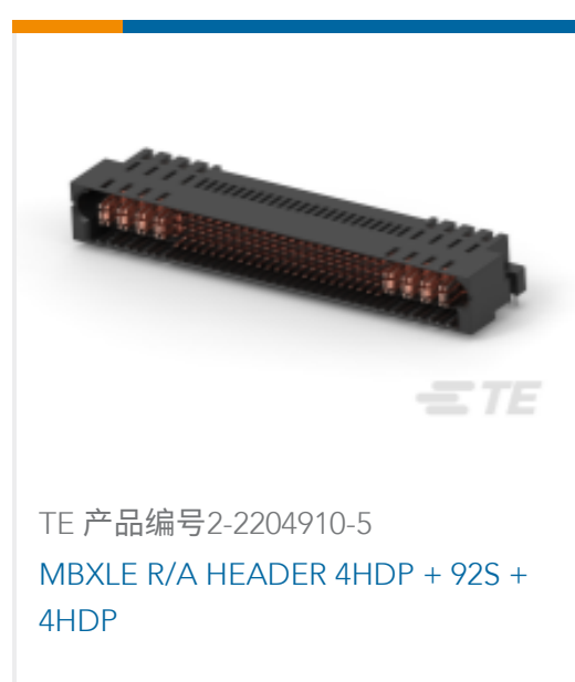
TE 产品编号2-2204910-5 MBXLE R/A HEADER 4HDP + 92S + 4HDP