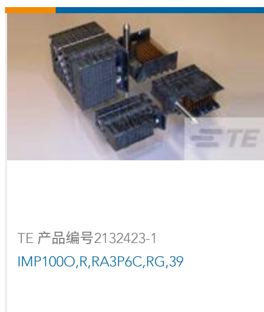
TE 产品编号2132423-1 IMP100O,R,RA3P6C,RG,39