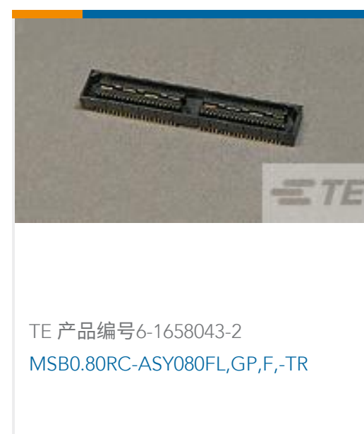
TE 产品编号6-1658043-2 MSB0.80RC-ASY080FL,GP,F,-TR