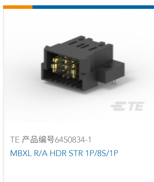
TE 产品编号6450834-1 MBXL R/A HDR STR 1P/8S/1P