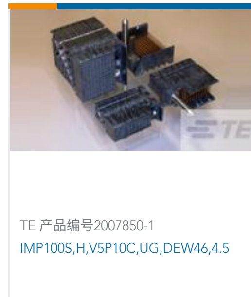
TE 产品编号2007850-1 IMP100S,H,V5P10C,UG,DEW46,4,5