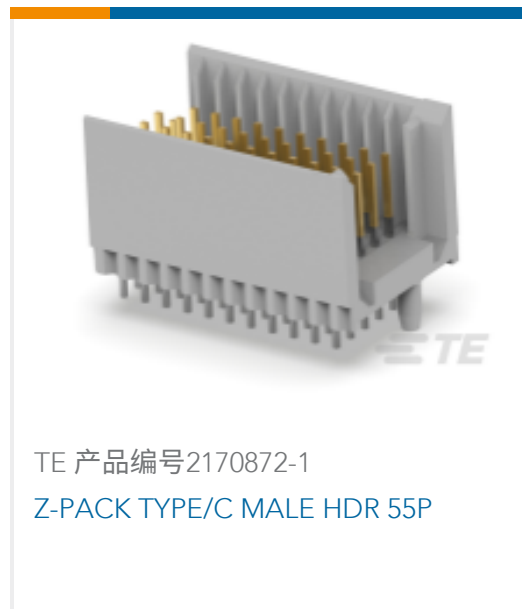
TE 产品编号2170872-1 Z-PACK TYPE/C MALE HDR 55P