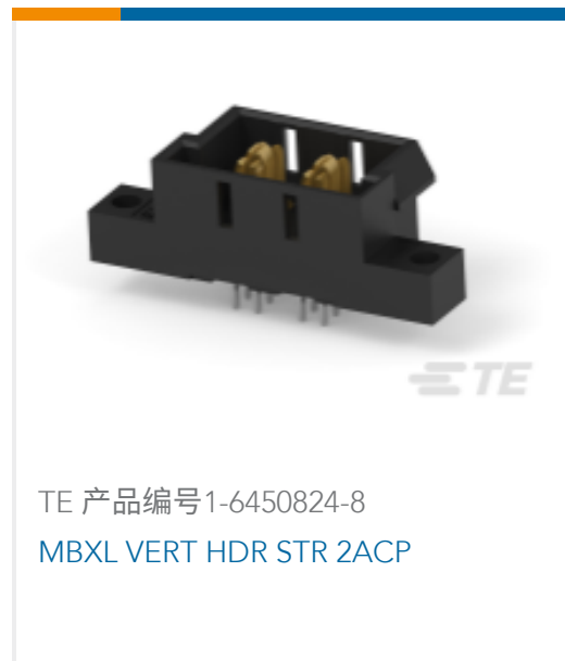
TE 产品编号1-6450824-8 MBXL VERT HDR STR 2ACP