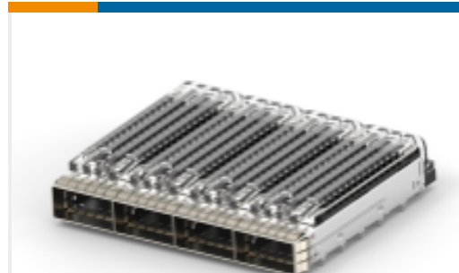
TE 产品编号5-2170790-4 CAGE ASSY, 1X4, QSFP28, SPRING, HS, LP