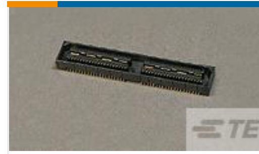
TE 产品编号6-1658043-2 MSB0.80RC-ASY080FL,GP,F,-TR