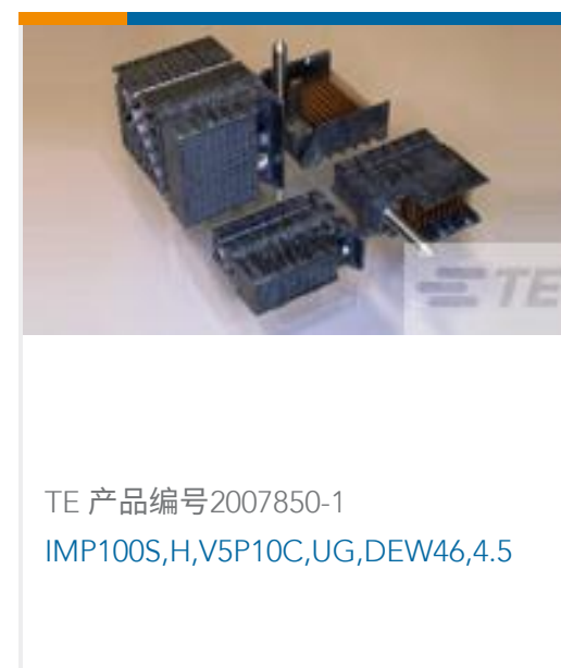
TE 产品编号2007850-1 IMP100S,H,V5P10C,UG,DEW46,4.5