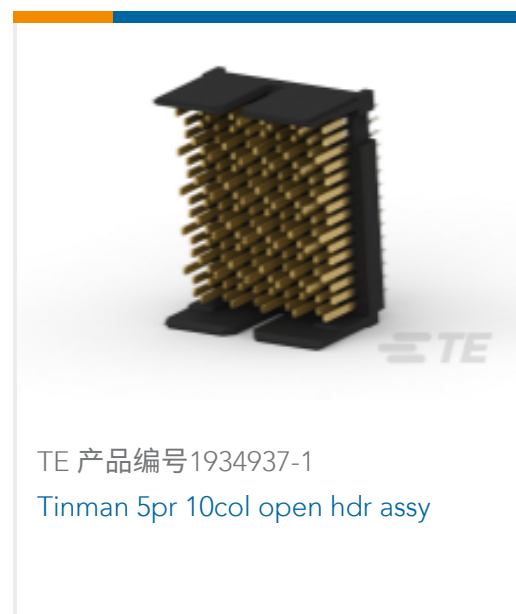
TE 产品编号1934937-1 Tinman 5pr 10col open hdr assy