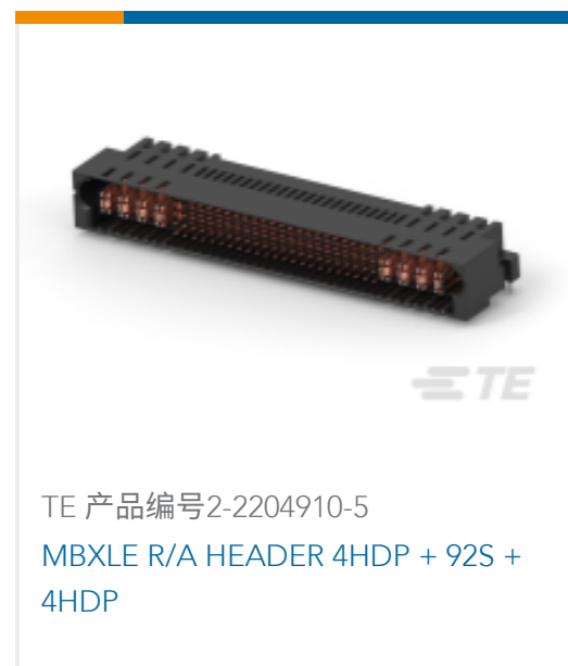
TE 产品编号2-2204910-5 MBXLE R/A HEADER 4HDP + 92S + 4HDP