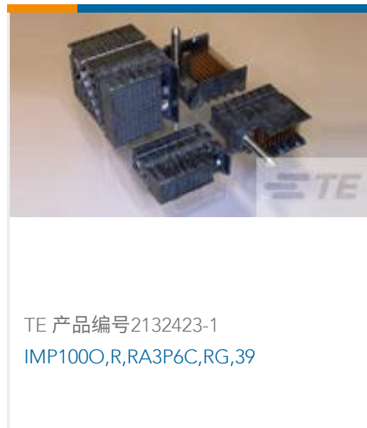
TE 产品编号2132423-1 IMP100O,R,RA3P6C,RG,39