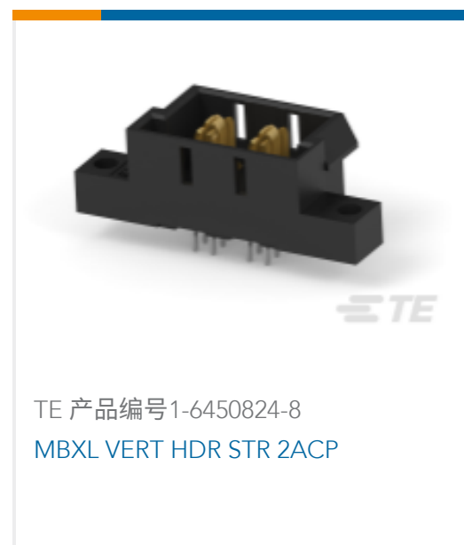
TE 产品编号1-6450824-8 MBXL VERT HDR STR 2ACP