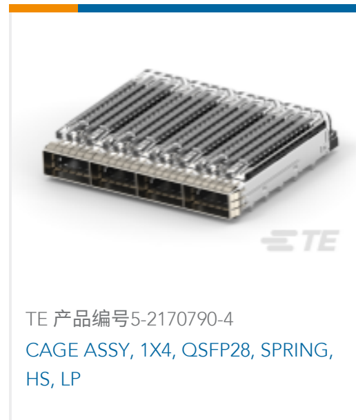
TE 产品编号5-2170790-4 CAGE ASSY, 1X4, QSFP28, SPRING, HS, LP