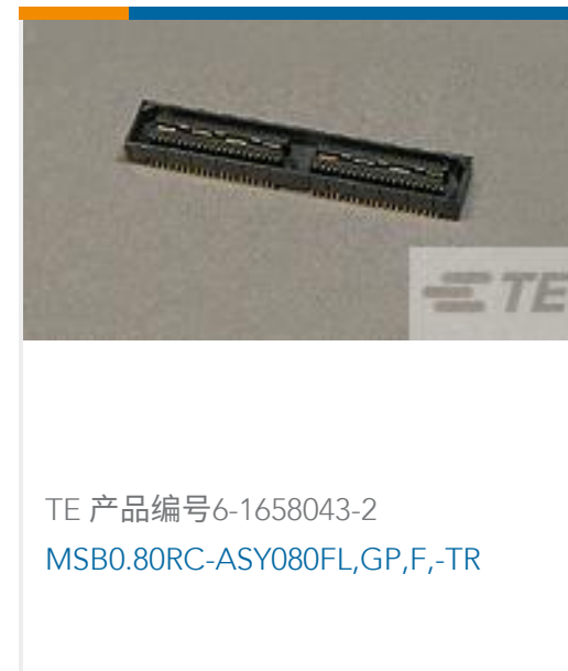
TE 产品编号6-1658043-2 MSB0.80RC-ASY080FL,GP,F,-TR