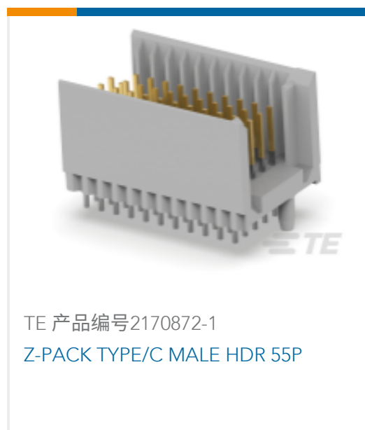
TE 产品编号2170872-1 Z-PACK TYPE/C MALE HDR 55P