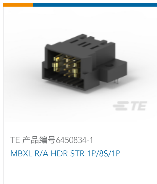
TE 产品编号6450834-1 MBXL R/A HDR STR 1P/8S/1P