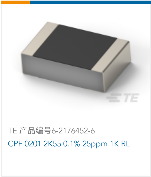
TE 产品编号6-2176452-6 CPF 0201 2K55 0.1% 25ppm 1K RL