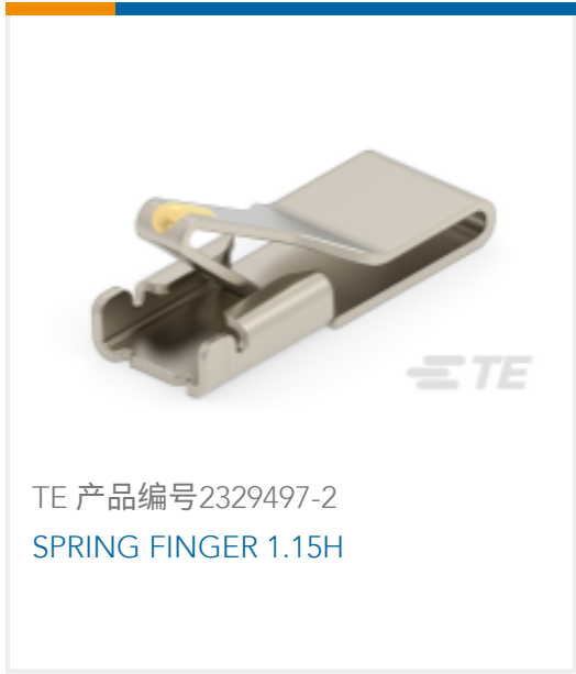
TE 产品编号2329497-2 SPRING FINGER 1.15H