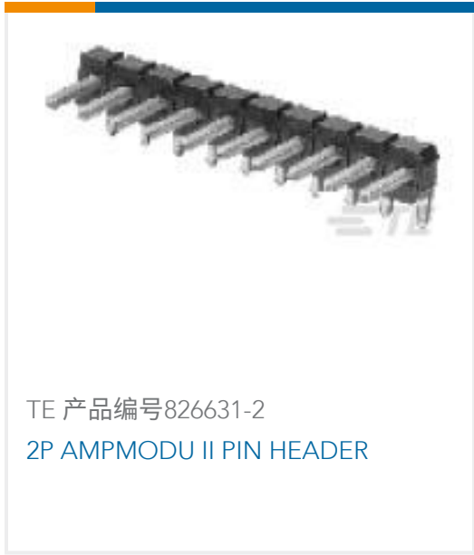
TE 产品编号826631-2 2P AMPMODU II PIN HEADER