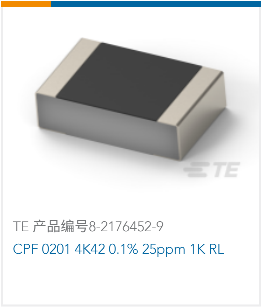
TE 产品编号8-2176452-9 CPF 0201 4K42 0.1% 25ppm 1K RL