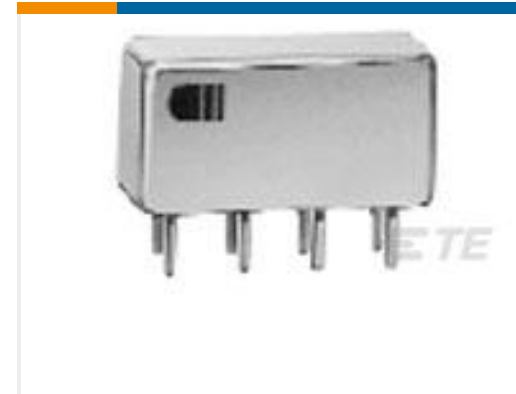
TE 产品编号1617038-7 HMB1130K01P = M39016/22-004P