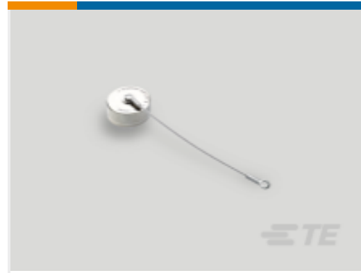
TE 产品编号YDTS33Z13RV0010000 CAP ASSEMBLY