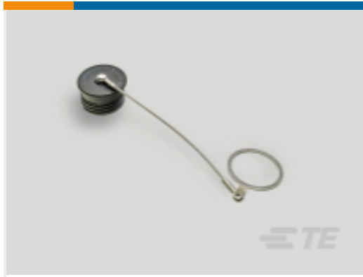
TE 产品编号YDTS32Z25NV0010000 CAP ASSEMBLY