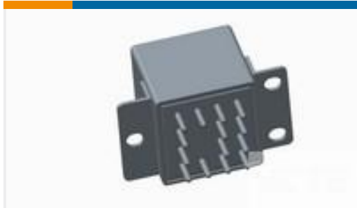
TE 产品编号1617805-4 TD229C-1203TY=TDFR 120 SEC