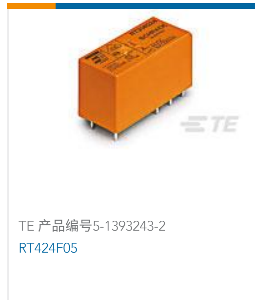
TE 产品编号5-1393243-2 RT424F05