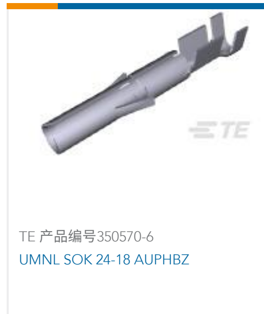
TE 产品编号350570-6 UMNL SOK 24-18 AUPHBZ