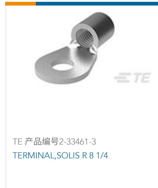
TE 产品编号2-33461-3 TERMINAL,SOLIS R 8 1/4