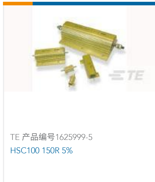
TE 产品编号1625999-5 HSC100 150R 5%