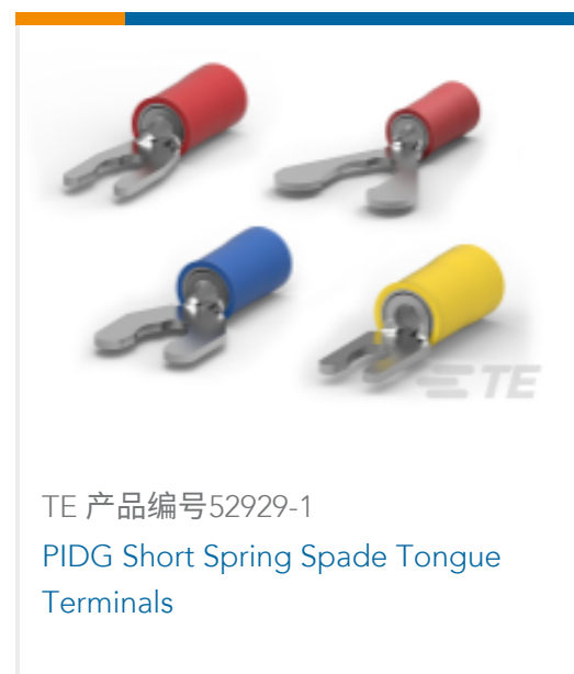
TE 产品编号52929-1 PIDG Short Spring Spade Tongue Terminals