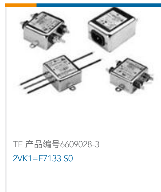
TE 产品编号6609028-3 2VK1=F7133 S0