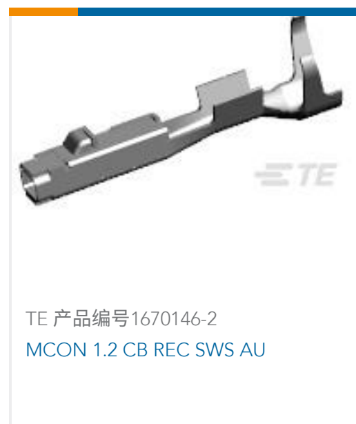
TE 产品编号1670146-2 MCON 1.2 CB REC SWS AU