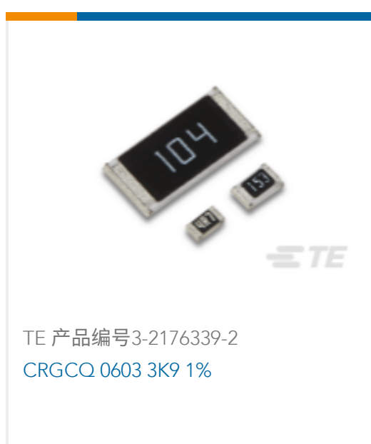
TE 产品编号3-2176339-2 CRGCQ 0603 3K9 1%