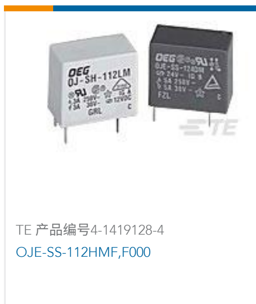
TE 产品编号4-1419128-4 OJE-SS-112HMF,F000