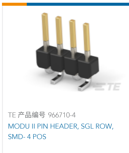
TE 产品编号 966710-4 MODU II PIN HEADER, SGL ROW, SMD- 4 POS