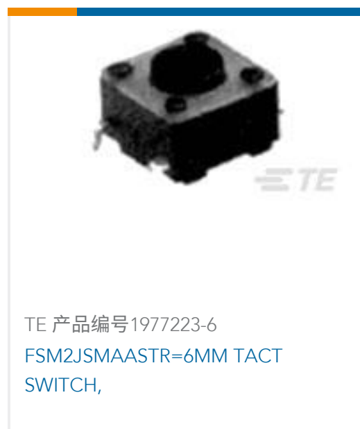
TE 产品编号1977223-6 FSM2JSMASTR=6MM TACT SWITCH,