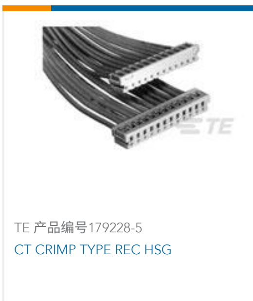
TE 产品编号179228-5 CT CRIMP TYPE REC HSG