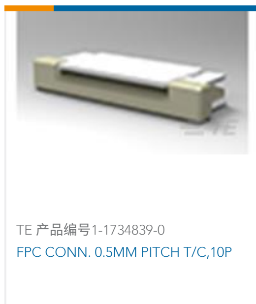
TE 产品编号1-1734839-0 FPC CONN. 0.5MM PITCH T/C,10P