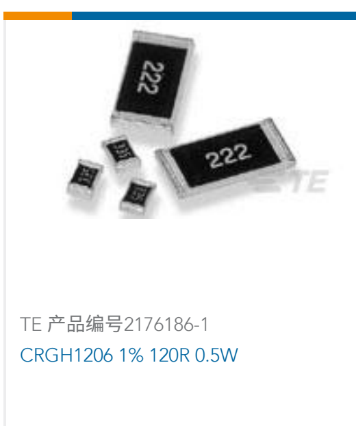
TE 产品编号2176186-1 CRGH1206 1% 120R 0.5W