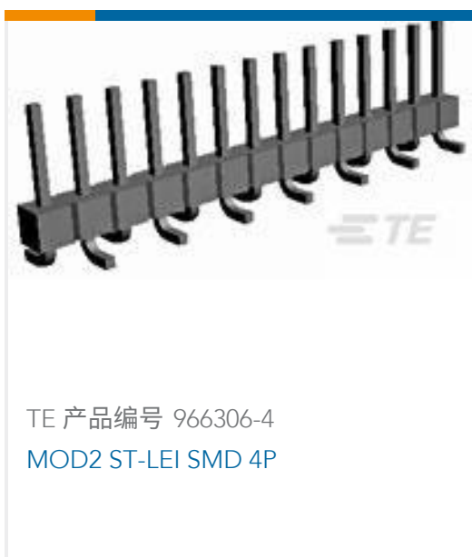
TE 产品编号 966306-4 MOD2 ST-LEI SMD 4P