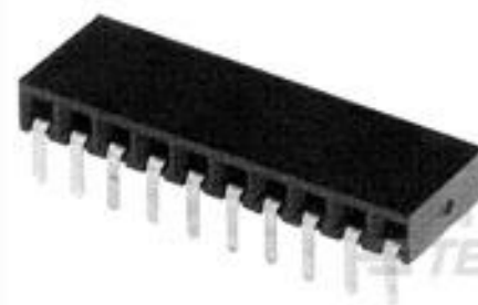
TE 产品编号 216602-7 7P HV190 FEDERLEIS