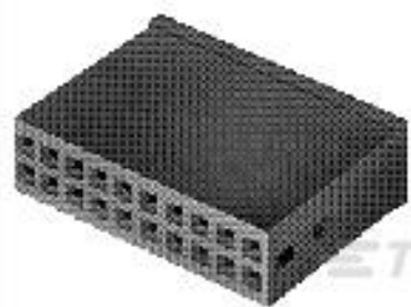
TE 产品编号 925369-7 7P MOD 4 HOUSING