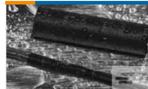
TE 产品编号121397P013 ES2000-NO.3-B8-0-41MM