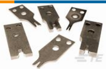
TE 产品编号6-1424909-6 CRIMPER, INSULATION "F"(.240")