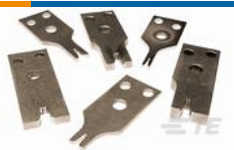
TE 产品编号6-1424909-6 CRIMPER, INSULATION "F"(.240")