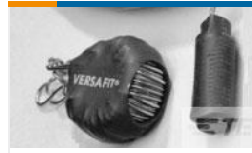
TE 产品编号CZ8200-000 VERSAFIT-3/4-0-2.25IN