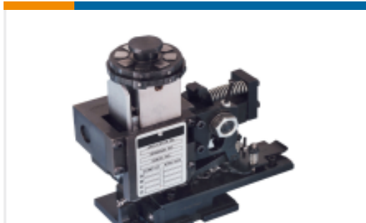
TE 产品编号680588-3 HDM 9HBAPR1405140OG