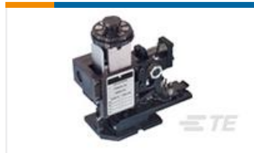
TE 产品编号567408-2 HDMHB 9EAPR160T180O G