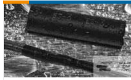
TE 产品编号121397P013 ES2000-NO.3-B8-0-41MM