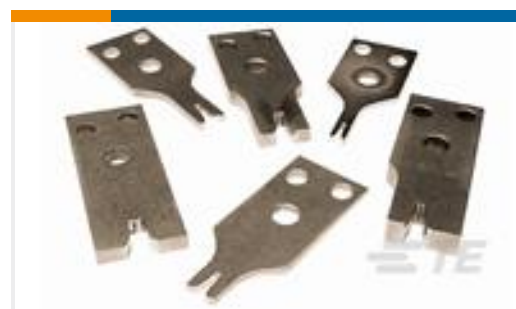
TE 产品编号6-456134-7 CRIMPER, INSULATION "F"(.210")