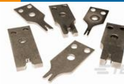
TE 产品编号6-456134-7 CRIMPER, INSULATION "F"(.210")