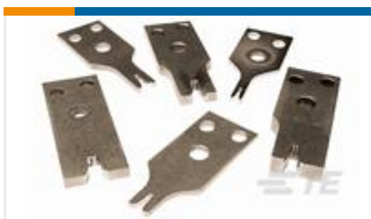
TE 产品编号6-456134-7 CRIMPER, INSULATION "F"(.210")