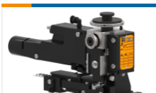
TE 产品编号2266615-2 OCEAN_2.0_Applicator-S-063F080O