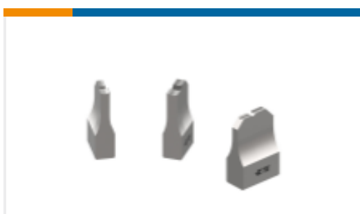
TE 产品编号6-1803257-0 ANVIL, COMBINATION, END FEED