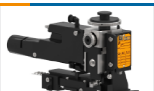
TE 产品编号2151475-2 OCEAN_2.0_Applicator-S-100F110F