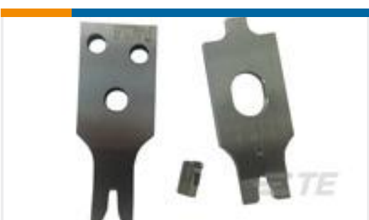
TE 产品编号7-2151605-7 OCEAN_2.0_SPARE_PART_KIT-160F190F