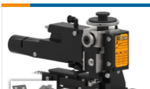
TE 产品编号7-2837831-2 OCEAN-2.0-APPLICATOR-S-110F