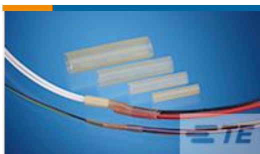
TE 产品编号CV09826001 RBK-VWS-125-NR3-X-33MM