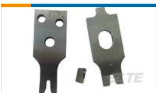
TE 产品编号7-2150158-7 OCEAN_2.0_SPARE_PART_KIT-080F110OV