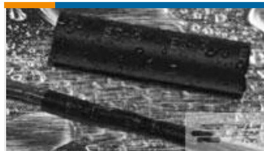
TE 产品编号CX2740-000 ES2000-NO.3-B8-0-130MM