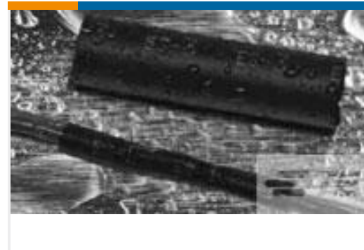
TE 产品编号121397P013 ES2000-NO.3-B8-0-41MM