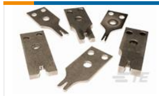
TE 产品编号6-456134-7 CRIMPER, INSULATION "F"(.210")