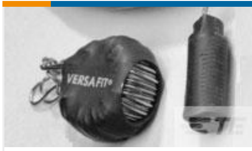
TE 产品编号CZ8200-000 VERSAFIT-3/4-0-2.25IN