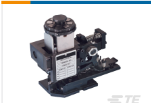
TE 产品编号680588-3 HDM 9HBAPR1405140OG