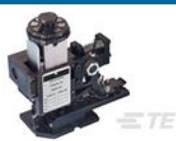
TE 产品编号567408-2 HDMHB 9EAPR160T1800 G