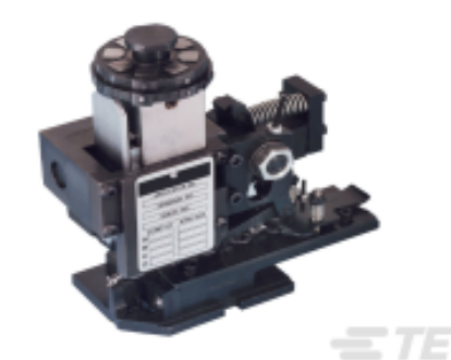
TE 产品编号680588-3 HDM 9HBAPR1405140OG