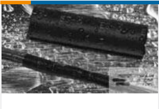
TE 产品编号121397P013 ES2000-NO.3-B8-0-41MM