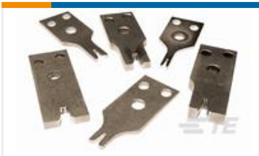
TE 产品编号6-1424909-6 CRIMPER, INSULATION "F"(.240")