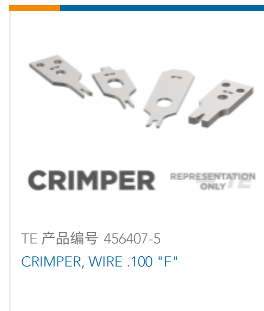
TE 产品编号 456407-5 CRIMPER, WIRE .100 "F"