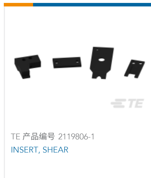
TE 产品编号 2119806-1 INSERT, SHEAR