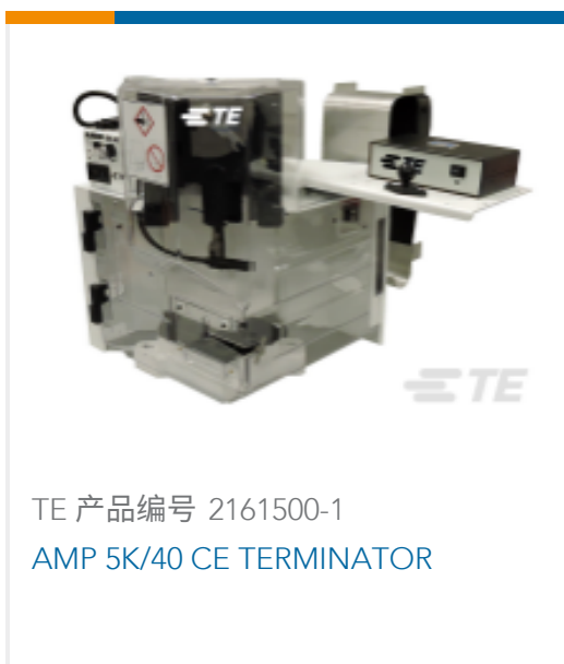
TE 产品编号 2161500-1 AMP 5K/40 CE TERMINATOR