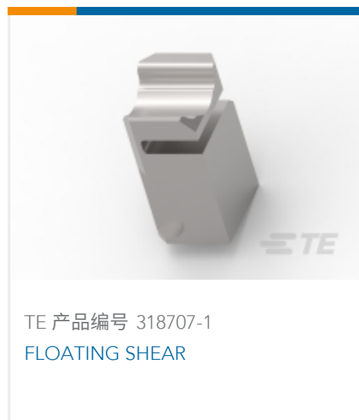
TE 产品编号 318707-1 FLOATING SHEAR