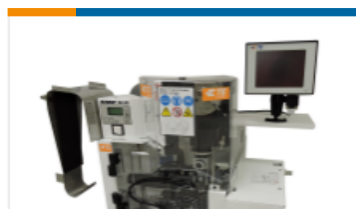
TE 产品编号 2161700-5 5K CE STRIPPING MODULE W/ CQM