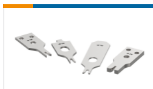
TE 产品编号 2-1633965-0 CRIMPER, INSULATION O PREMIUM