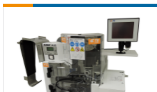
TE 产品编号 2161700-4 5K CE STRIPPING MODULE