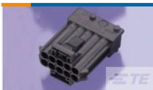
TE 产品编号 185001-6 4P TAB JPT HOUSING