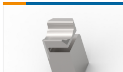
TE 产品编号 318707-1 FLOATING SHEAR