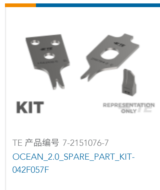
TE 产品编号 7-2151076-7 OCEAN_2.0_SPARE_PART_KIT- 042F057F