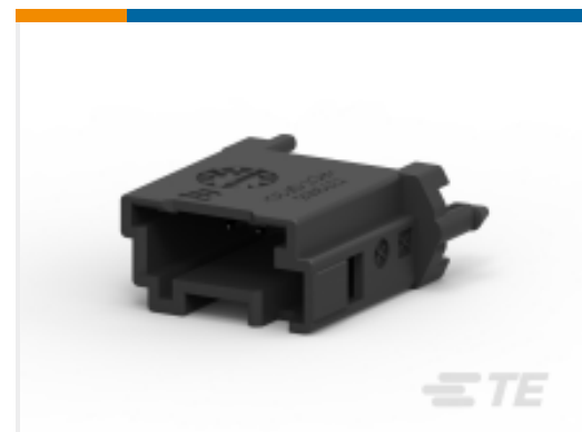
TE 产品编号1-1379165-7 4pos MQS .63 header 180deg THR