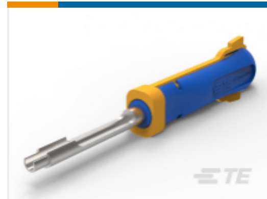
TE 产品编号1-1579028-4 EXTRACTION TOOL