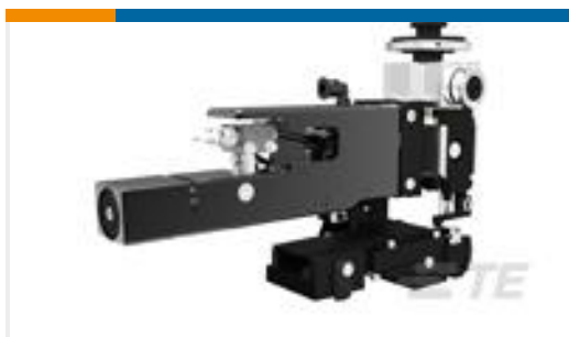
TE 产品编号2266226-2 OCEAN-2.0-APPLICATIONER-S-180F250OV