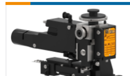
TE 产品编号5-2151056-2 OCEAN_2.0_APPLICATIONER-S-062F130O