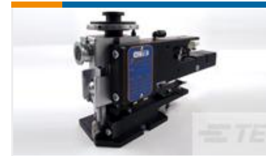
TE 产品编号2150034-2 OCEAN_2.0_APPLICATIONER-E-110F180F