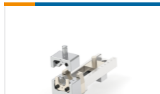
TE 产品编号2351900-2 DIE SET2 IPT-180-1/2/3P F 50MM2