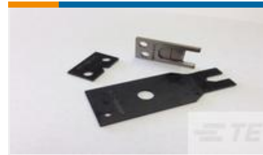
TE 产品编号1-2217206-5 Blade, Slug