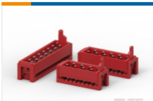
TE 产品编号215083-6 Male-on-Wire Connector, Micro-MaTch