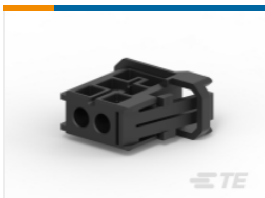
TE 产品编号1-1418862-0 2POS. FIBER OPTIC HARNESS CONNECTOR