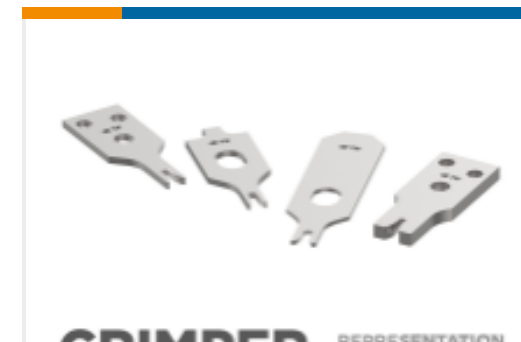
CRIMPER REPRESENTATION ONLY