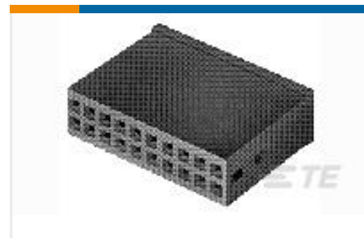
TE 产品编号87133-2 10 LOCKING CLIP HSG DR .100CL