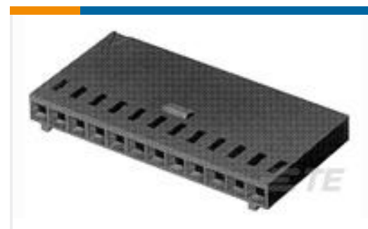
TE 产品编号280363 AMPMODU II REC. HSG, SINGLE ROW, 15 POS.