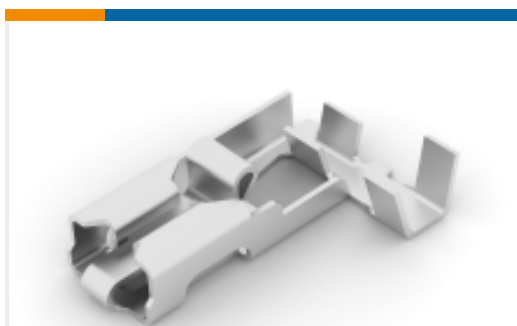
TE 产品编号282349-1 PL 250 FLAG REC 0.5-1.5MM2 0.4 X 44 NISI