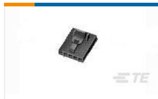
TE 产品编号1-104257-4 15 MTE RCPT HSG SR LATCH .100