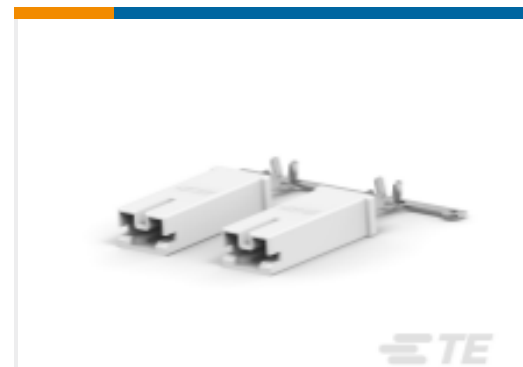
TE 产品编号2299282-3 POD-LOK 250 STR. AWG 14-12 TPBR GF