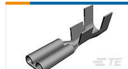
TE 产品编号41274-1 250 FASTON, REC., 18-14 AWG, TPBR