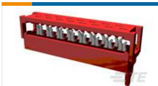
TE 产品编号215083-6 MICRO-MATCH MOW.06P