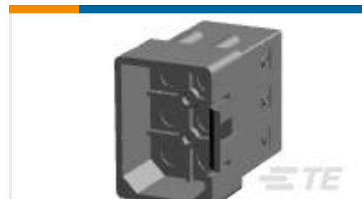
TE 产品编号770361-1 06P .093 COMM P&S PLUG .250CL