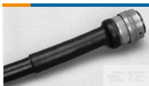
TE 产品编号CV67226001 ATUM-24/8-2-30MM