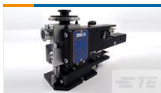
TE 产品编号2150393-2 OCEAN_2.0_Applicator-E-170F224FA