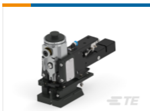
TE 产品编号2150706-1 OCEAN_2.0_Applicator-E-094F134F