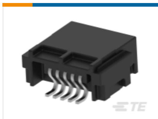
TE 产品编号2323101-5 5POS,TAB0.5X0.4,HEADER ASSY,90 DEG