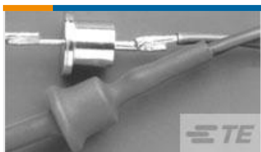
TE 产品编号0662472004 RNF-3000-12/4-3-STK