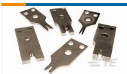
TE 产品编号3-459492-9 CRIMPER, WIRE "O"