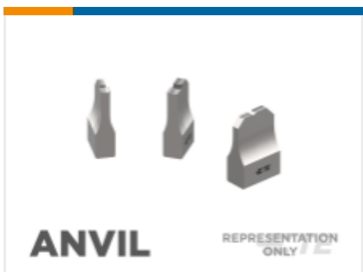
TE 产品编号1-1803171-5 ANVIL, COMBINATION