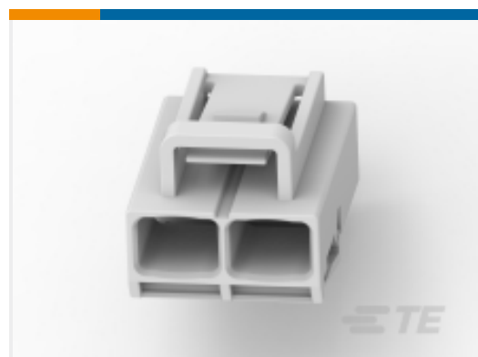
TE 产品编号2-1418506-2 AMP MCP 6.3 REC. 2 POS HSG