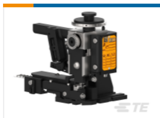
TE 产品编号2266923-1 OC-AT-S-FM-062F090F-111-0298