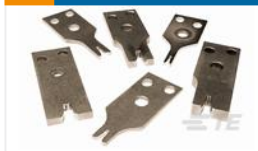
TE 产品编号6-1424909-6 CRIMPER, INSULATION "F"(.240")