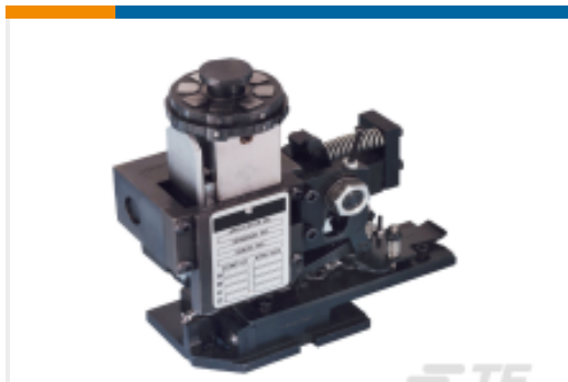
TE 产品编号680588-3 HDM 9HBAPR1405140OG