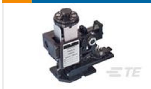
TE 产品编号567408-2 HDMHB 9EAPR160T180O G