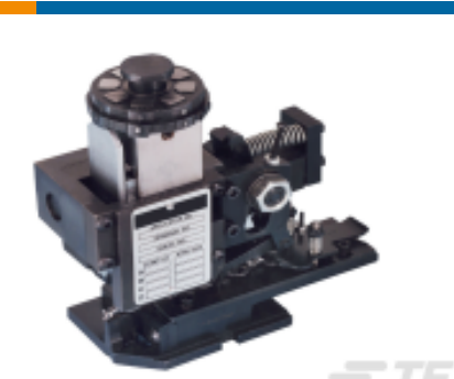
TE 产品编号680588-3 HDM 9HBAPR1405140OG