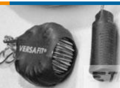
TE 产品编号CZ8200-000 VERSAFIT-3/4-0-2.25IN