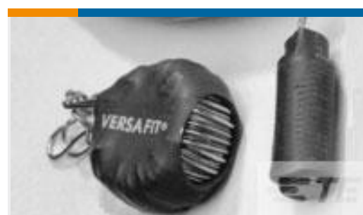
TE 产品编号CU4296-000 VERSAFIT-3X-3/8-0-30MM