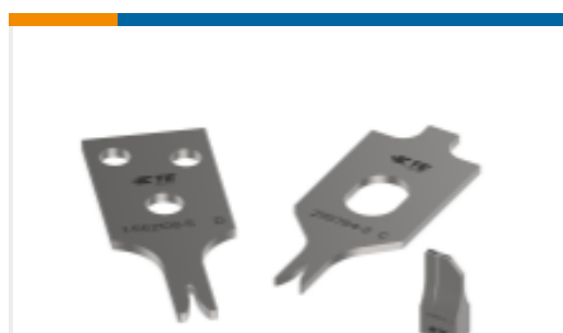
TE 产品编号7-2150585-7 OC-210F250F-CRIMPTOOLINGKIT