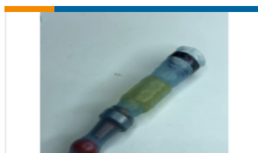
TE 产品编号EM1221-000 SGRS-3-96