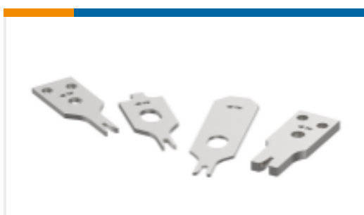
TE 产品编号6-1803224-7 CRIMPER,WIRE F