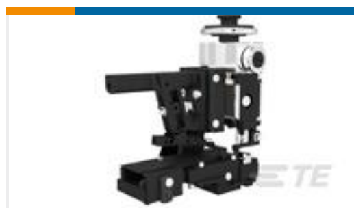
TE 产品编号2266037-1 OCEAN_2.0_Applicator-S-080F1200