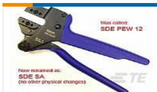
TE 产品编号2063524-1 SDE MCP1.5 0.2-1.0mm2 ASSY