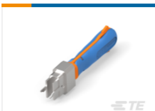
TE 产品编号7-1579028-3 LOCKING TOOL 10POL