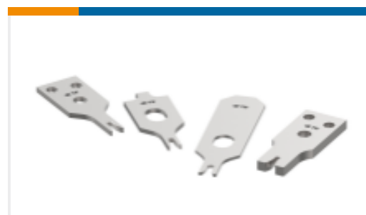
TE 产品编号6-1633609-2 CRIMPER, WIRE F