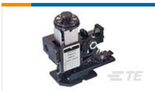
TE 产品编号567408-2 HDMHB 9EAPR160T180O G