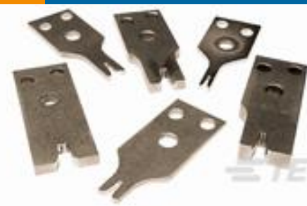
TE 产品编号6-1424909-6 CRIMPER, INSULATION "F"(.240")