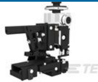
TE 产品编号2266037-1 OCEAN_2.0_Applicator-S-080F1200-RSM