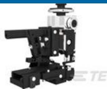
TE 产品编号2151880-1 OC-AT-S-FM-070F145O-001-0024