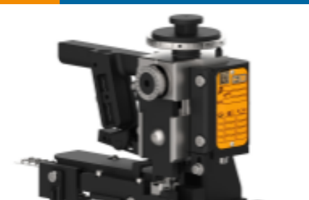
TE 产品编号2266741-1 OCEAN_2.0_Applicator-S-116F111F-RSM