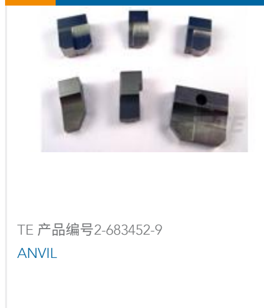
TE 产品编号2-683452-9 ANVIL