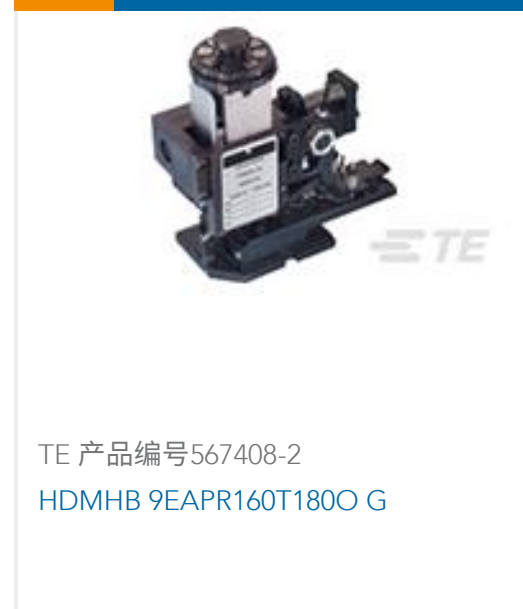
TE 产品编号567408-2 HDMHB 9EAPR160T180O G