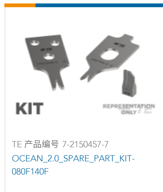
TE 产品编号 7-2150457-7 OCEAN_2.0_SPARE_PART_KIT- 080F140F