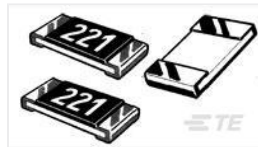
TE 产品编号2-1879005-3 3520 510R 5%