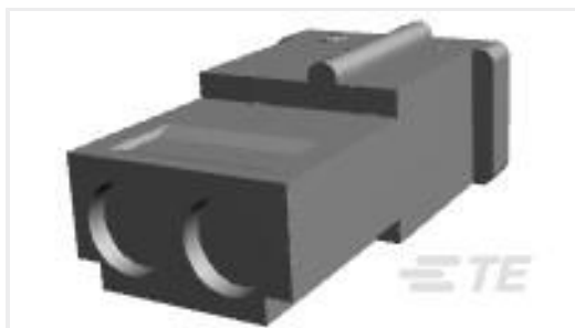
TE 产品编号1-480318-0 02P CMNL PLUG HSG F/H NATL