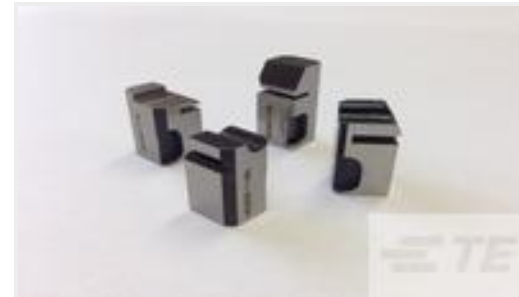
TE 产品编号318707-1 FLOATING SHEAR