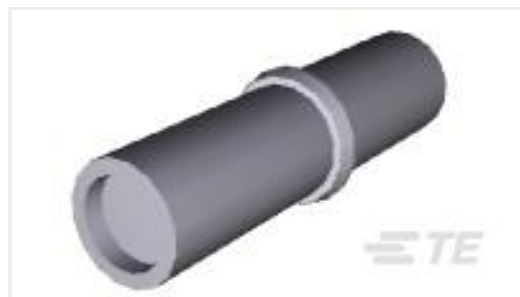
TE 产品编号1-480349-0 01P CMNL PLUG HSG F/H NATL