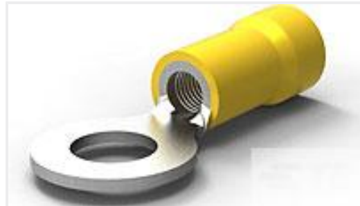
TE 产品编号165035 PLASTI-GRIP, RING, 12-10 1/4