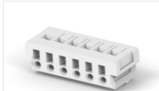
TE 产品编号175778-6 CT CRIMP REC HSG 6P NATURAL