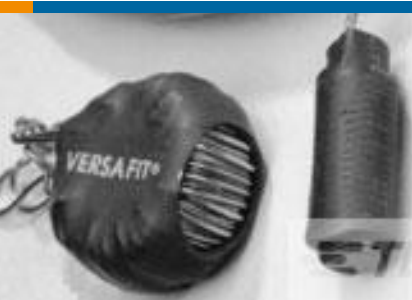
TE 产品编号CZ8200-000 VERSAFIT-3/4-0-2.25IN