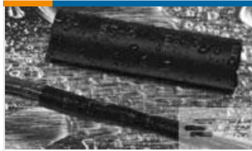
TE 产品编号CX2740-000 ES2000-NO.3-B8-0-130MM