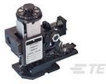
TE 产品编号567408-2 HDMHB 9EAPR160T180O G