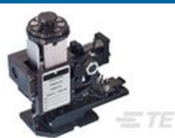
TE 产品编号567408-2 HDMHB 9EAPR160T1800 G