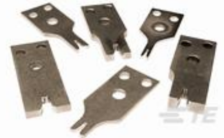
TE 产品编号6-1424909-6 CRIMPER, INSULATION "F"(.240")