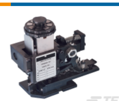
TE 产品编号680588-3 HDM 9HBAPR1405140OG