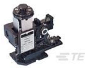
TE 产品编号567408-2 HDMHB 9EAPR160T180O G