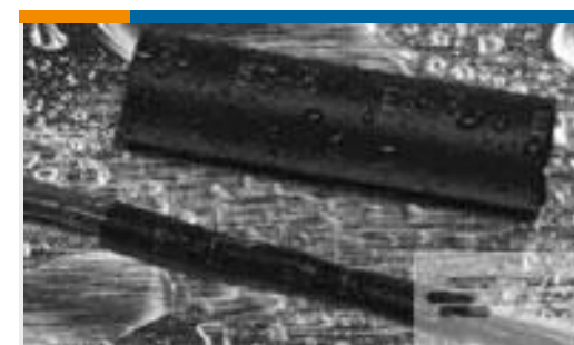
TE 产品编号121397P013 ES2000-NO.3-B8-0-41MM