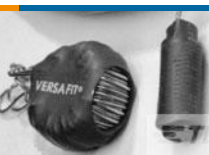
TE 产品编号CZ8200-000 VERSAFIT-3/4-0-2.25IN