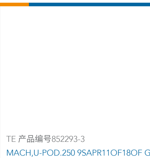
TE 产品编号852293-3 MACH,U-POD.250 9SAPR11OF18OF G