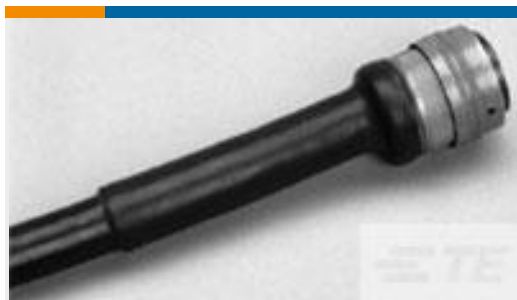
TE 产品编号CV67236001 ATUM-24/8-2-40MM