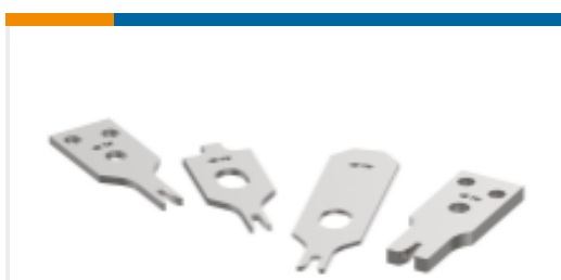
TE 产品编号1803090-1 CRIMPER, INSUL. F, SPECIAL