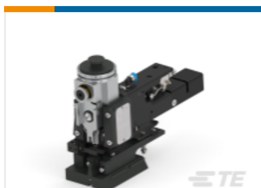
TE 产品编号2150873-1 OC-AT-E-FM-080F130F-001-0056