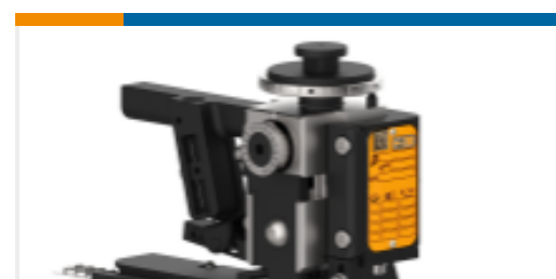
TE 产品编号2837316-1 OCEAN-2.0-APPLICATOR-S-055F070F-RSM