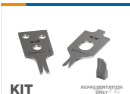
TE 产品编号7-2151321-7 OCEAN_2.0_SPARE_PART_KIT-140F190O180F