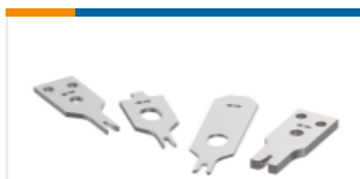
TE 产品编号1803090-2 CRIMPER, INSUL. F, SPECIAL