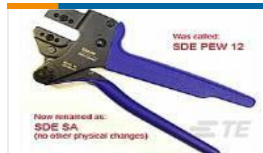
TE 产品编号1752938-1 PEW 12 TOOL(3-5MM MATE-N-LOK)