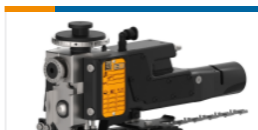
TE 产品编号2150603-2 OCEAN_2.0_Applicator-E-090F130F-REA