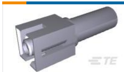
TE 产品编号926472-1 UNIV.M-N.L.CAP S.C.