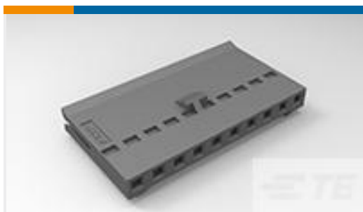
TE 产品编号1-487769-4 016 HOUSING FFC RCPT 100CL SR