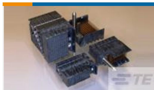
TE 产品编号2007815-1 IMP100S,H,V4P10C,RG,LEW39,4.5