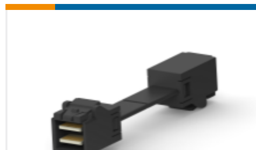
TE 产品编号2820350-2 C/A, INTERNAL HD MINI SAS, 100 OHM, STR