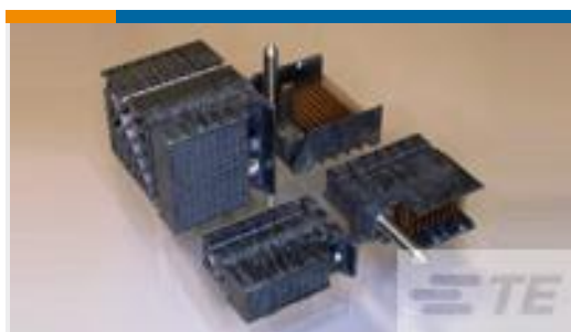
TE 产品编号 2132742-1 IMP100S,R,RA4P6C,UG,46