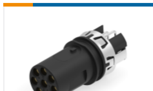
TE 产品编号225301-E M12 FEMALE, A CODE, RA, 8P THR REAR MOUNT