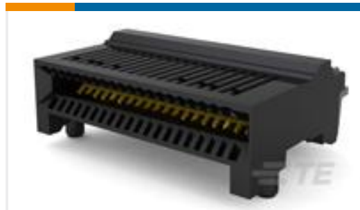
TE 产品编号1551920-2 zQSFP+ connector assembly