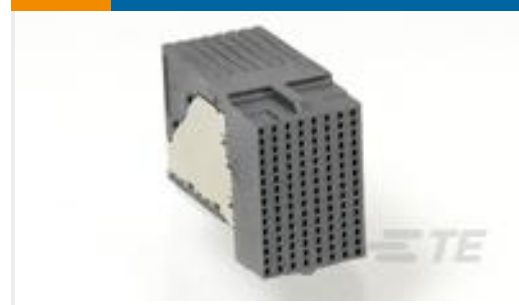
TE 产品编号1934226-1 Tin man Recept Assy3pair8 Colum