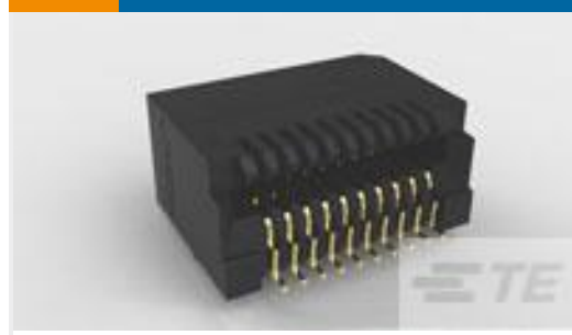
TE 产品编号1888247-1 20 POS SMT CONN, SFP/SFP+, 30A