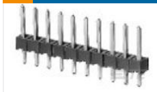
TE 产品编号5-146280-2 02 MODII HDR SRST B/A .100CL