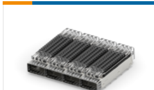
TE 产品编号2170378-2 1X4 QSFP KIT ASSY LP&HS