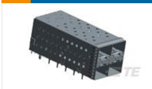
TE 产品编号2007637-8 SFP+ assy 2x2 Spring Fingers N