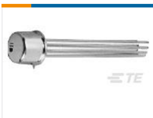
TE 产品编号7-1617351-9 JM5CD-18XL=M39016/16-040L