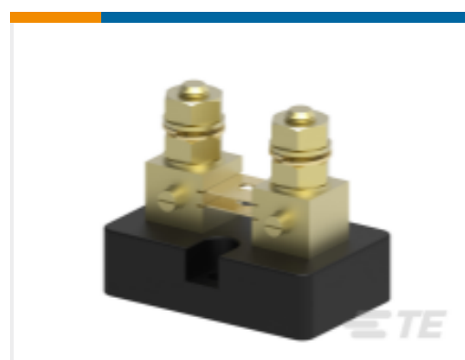
TE 产品编号CG3319-000 CI-TM5050